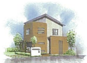
シンプルナチュラル